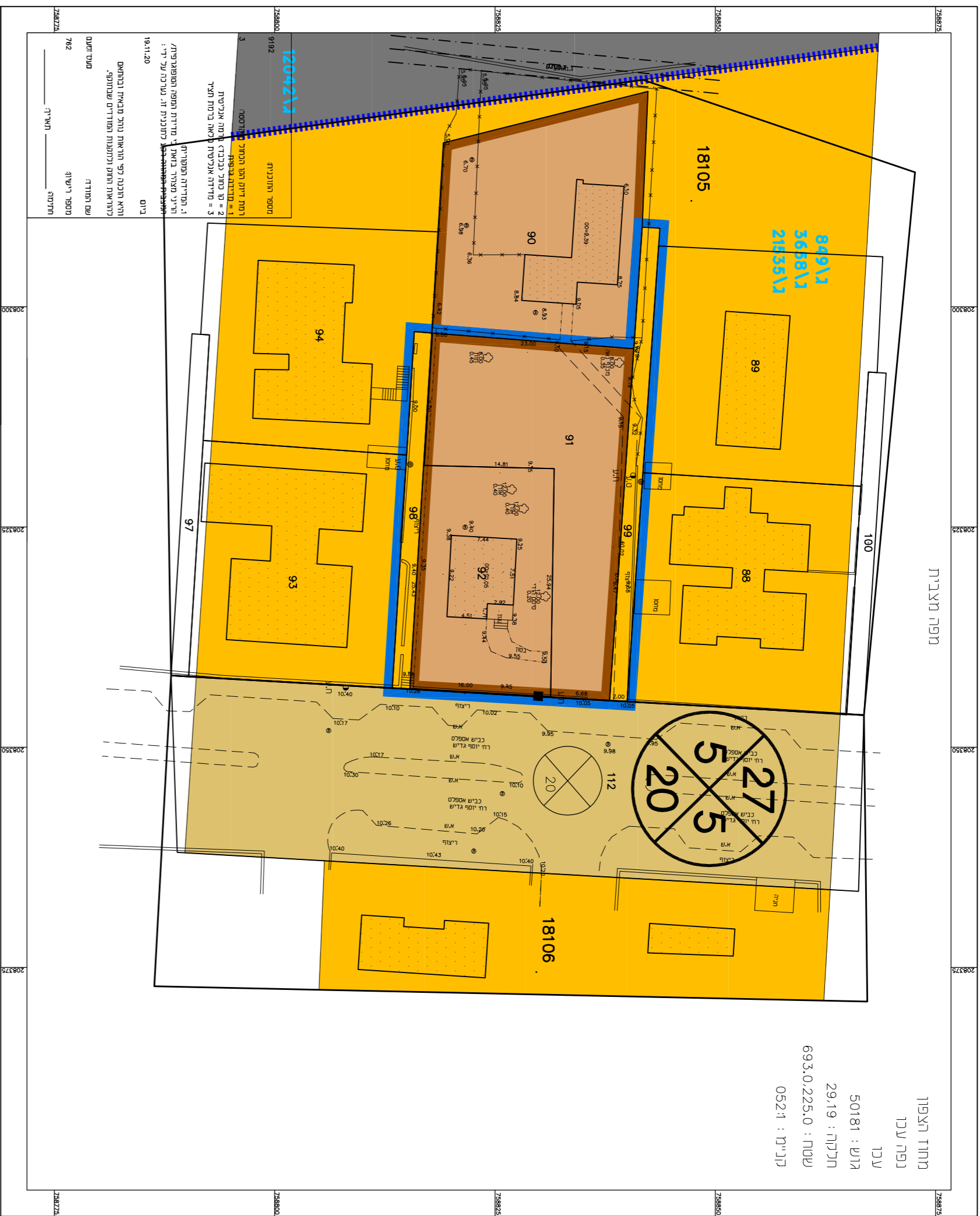
מצב מאושר ק"ח 1:500